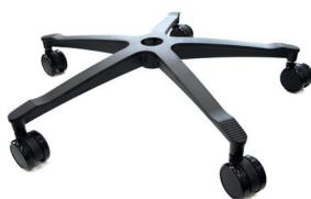
Fußkreuz in schwarz pulver- beschichtetes Aluminium (Standard)